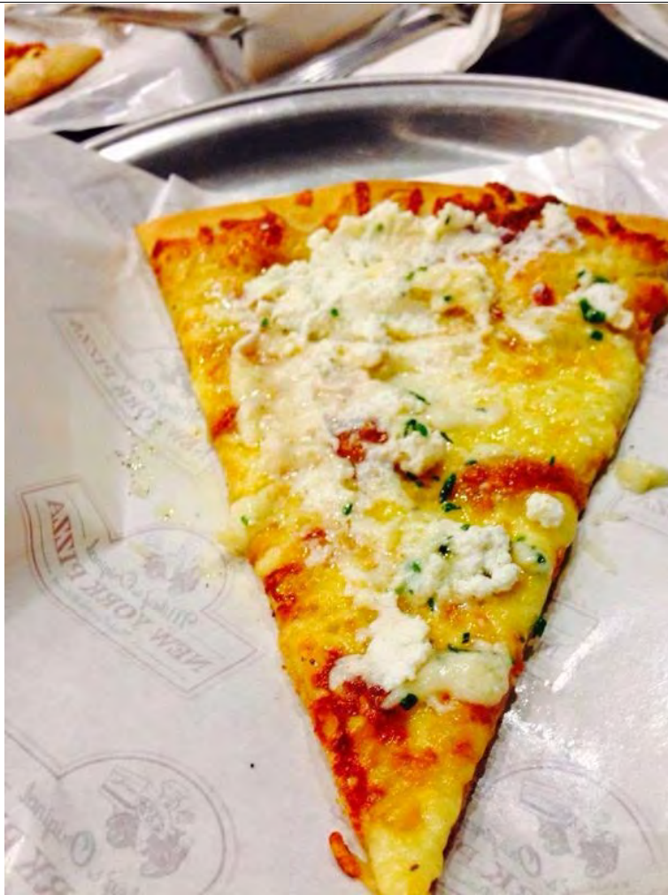
The Tony Soprano. Siapa gila cheese macam I, sila order ni. Jangan kau muak jakgi sudah haha. Sedap!