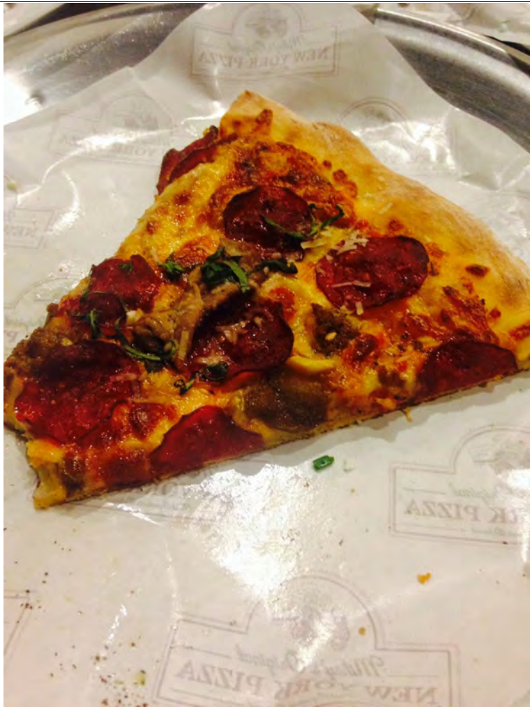
Pizza Bianco. Sedap sangat!

pizza in town! I surely will come again. So, I makan kedua-duanya tanpa menghiraukan perut gelebeh di depan >.< Alasannya, I puasa so takpa makan banyak sebab esok pun nak puasa straight 3 hari. Yerlah.