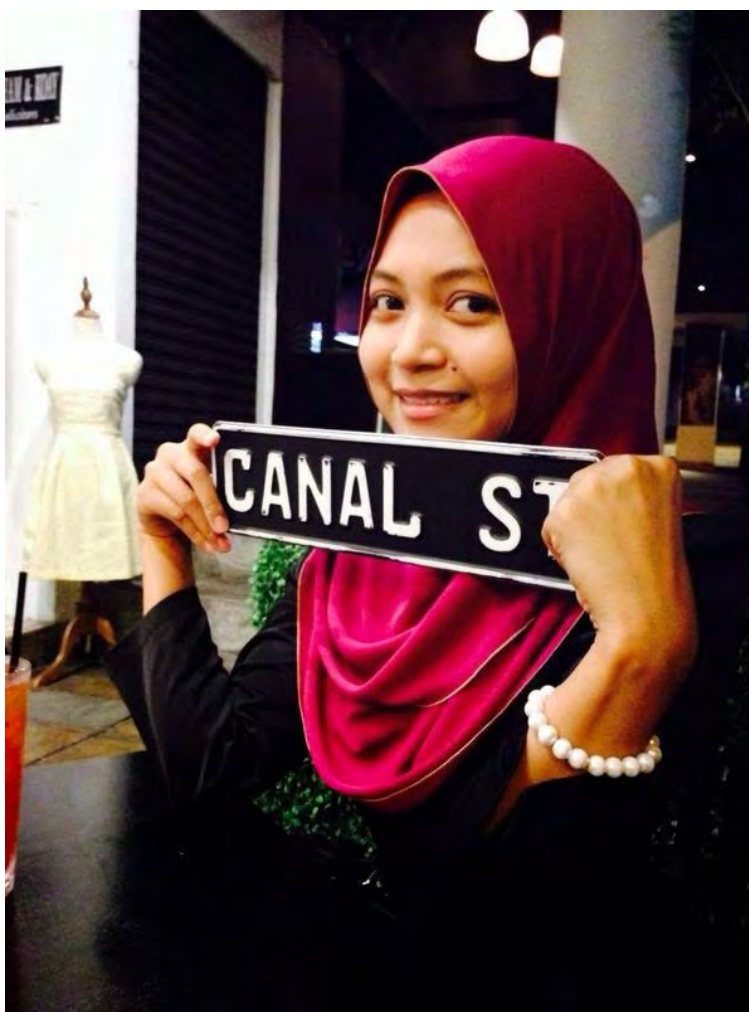
Balik kerja terus pergi, harus lah berbaju kurung makan dekat New York. Haha.

Sekarang ni I frust gila. Gambar yang I send dalam email semua corrupted! T_T. Entah apa salahnye tah Grrrrrr. So, yang tinggal hanya gamba pizza.